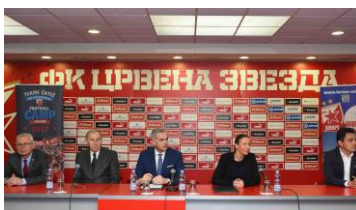
Slika 13: Podpis pogodbe

Ob odprtju novih peščenih igrišč na mivki (v sklopu investicije/razširitve kampa) smo otvoritvene tekme izvedli z Odbojgarsko zvezo Slovenije.