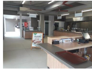
Slika 3: Snack bar