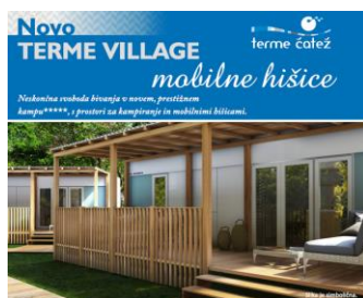
Slika 16: Terme Village

Za poletno animacijo (julij, avgust), ki se dogaja na različnih mikro-lokacijah Čateža, smo izdelali brošuro z zbirom večernih dogodkov ter poudarkom na športu in novostih: tečajih preživetja v naravi, igranju tenisa in odbojke na novih peščenih igriščih.