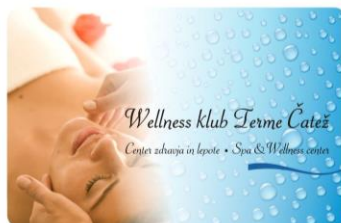
Slika 15: Wellness kartica

Poleg zdravja smo aktivno delali tudi na promociji wellness storitev. Z 'wellness kartico zvestobe' Term Čatež smo pričeli ponujati ugodnosti gostom ob koriščenju več storitev, v spomladanskem času pa smo pripravili tri nove programe. Programi Anti-age & antistress, Program za razstrupljanje telesa in Shujševalni program Term Čatež se izvajajo v sklopu wellness centrov hotela Terme in hotela Čatež ter ob spremljanju ekipe zdravnikov, fizioterapevtov ter nutricionistov.