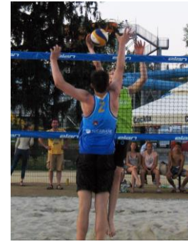
Slika 2: Novi povezovalni most in novo igrišče za odbojko