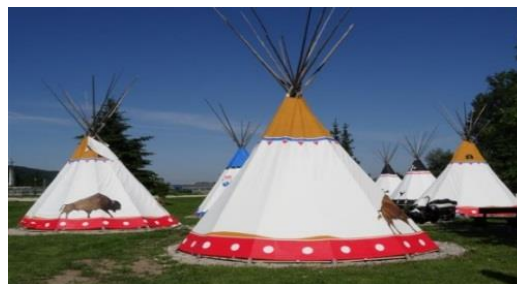
Slika 4: Indijansko naselje

Obstoječe indijansko naselje se je prenovilo z novimi šotori in opremo. Lokacija ima primerjalno prednost bivanja ob vodi in neposrednem stiku z naravo.