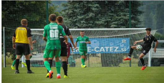
Slika 5: Nogometno igrišče

Ob novem nogometnem igrišču smo zaradi zahtev trga izgradili dva nogometna igrišča. Igrišča sta v prvi vrsti namenjena treningom v neugodnih vremenskih razmerah.