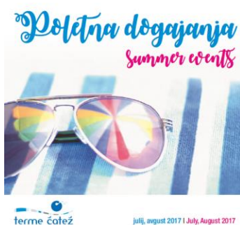
Slika 17: Promocijski letak poletna dogajanja

Za poletno animacijo (julij, avgust), ki se dogaja na različnih mikro-lokacijah Čateža, smo izdelali brošuro z zbirom večernih dogodkov ter poudarkom na športu in novostih: tečajih preživetja v naravi, igranju tenisa in odbojke na novih peščenih igriščih.