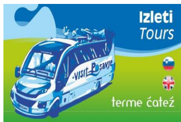
Slika 18: Promocijski letak izleti

V sodelovanju z lokalnim partnerjem (ki prevzema prevoze in organizacijo) smo pripravili brošuro izletov v bližnjo in nekoliko oddaljeno okolico. Brošura izletov je na voljo gostom v vseh namestitvenih objektih na lokacijah Čateža in Mokric, hkrati so bistvene informacije na voljo tudi na vsaki recepciji namestitvenega objekta.