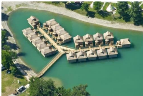
Slika 7: Gusarski zaliv

Obnovili smo streho, ograje in ostale lesene elemente plavajočih hišk.