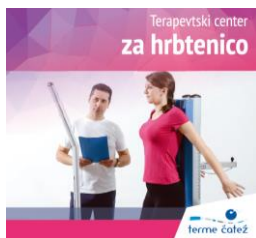
Slika 14: Promocijski letak

tiskano brošuro z osnovnimi informacijami ter hkrati tudi dodatno prilogo k brošuri, kjer si pacient že vpisuje konkretne aktivnosti in program izvedbe vaj. Promocijo smo zaželi izvajati tudi s posameznimi strokovnimi portali in revijami; v juniju smo bili s člankom o novem centru prisotni tudi v reviji slovenskih lekarn. Med prvimi, ki so preizkusili Terapevtski center, je bila tudi prva ekipa slovenskih skakalcev. S promocijo bomo nadaljevali tudi v jesenskih in zimskih mesecih.