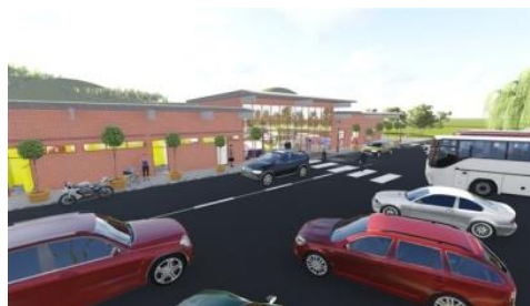
Slika 10: Nova recepcija