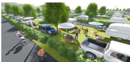
Slika 11: Novo postajališče

Neposredno nasproti nove recepcije se bo umestilo sodobno postajališče za prihajajoče avtodome za enodnevni postanek in v nadaljevanju sodoben tranzitni kamp velikosti 28 enot z vso potrebno infrastrukturo kampa petih zvezdic. Na lokaciji potekajo infrastrukturna in začetna gradbena dela. Družba je pridobila vsa potrebna soglasja. Dokončanje investicije se načrtuje do 30.05.2018.