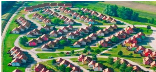
Slika 6: Apartmajsko naselje

Obnovili smo apartmaje (obnova pohištva, talnih oblog, prenova kuhinj, novi TV sprejemniki, slikopleskarska dela).