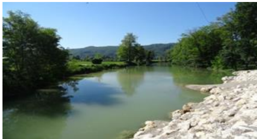
Slika 8: Slika odvodnika

Družba Terme Čatež, d.d., je izgradila nov fekalni-komunalni sistem s priključitvijo na prenovljeno čistilno napravo Terme Čatež. S projektom se je saniralo stanje na obstoječem kompleksu za pridelavo cvetja in zelenjave ter hkrati priključilo vse nove investicije v letu 2017 (Terme Village, Snack bar, tranzitni del kampa itd.).