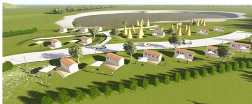
Slika 9: Novi vhod s povezovalno cesto

Na lokaciji med nogometnim igriščem in objektom CASTLES se je umestila nova povezovalna cesta preko sedanjega kompleksa proizvodnje cvetja do središča obstoječega kompleksa kampa. Nova cesta se konča na lokaciji restavracije PRI KAPITANU z ustrežno tematsko infrastrukturo. Skupna dolžina nove prometnice je 800 m. Izveden je kompletni grobi ustroj povezovalne ceste. Asfaltiranje prve faze ceste se je izvedlo v maju 2017. Dokončanje investicije se načrtuje do 30.05.2018.