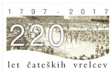
Slika 12: Promocija obletnice

Rdeča nit Term Čatež ves čas ostaja termalna voda. Zgodbo o 220-letnici odkritja in prvih zapisov zdravilnih učinkov smo predstavili z akcijo '220 let za 220 dni' (termalnih užitkov na Termalni rivieri); vsak 220. gost Termalne riviere bo tako od spomladi do jeseni – 220 dni – dnevno nagrajen z brezplačno vstopnico.