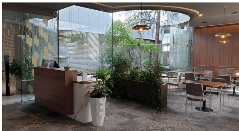
Slika 4: Prenovljeni vhod v restavracijo