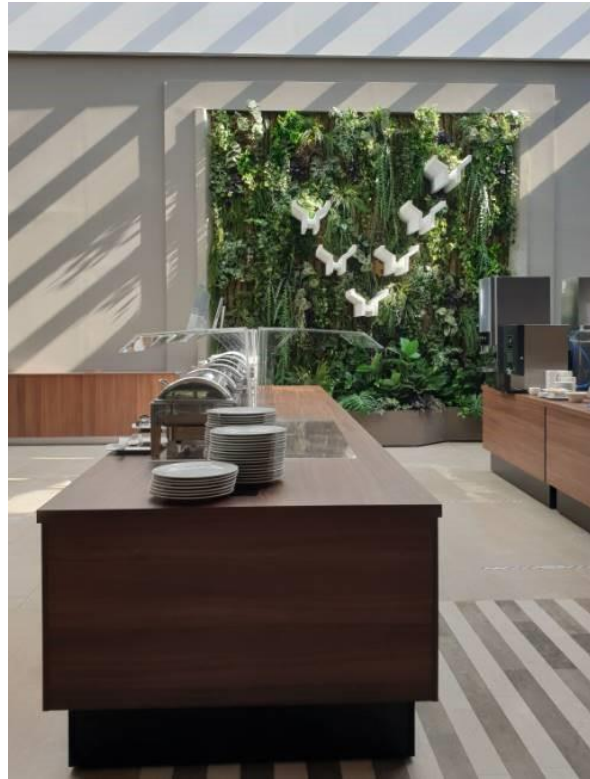
Slika 3: Prenovljena restavracija

Hotel Terme je hotel z največjo kapaciteto gostov v kompleksu Term Čatež in po velikosti drugi največji hotel v Sloveniji s skupno kapaciteto 226 sob. Restavracija Hotela Terme je bila zgrajena v sklopu Hotela Terme. V letošnjem letu je prenova zajemala menjavo tekstilne talne obloge, prenavo keramičnih površin, prenavo stolov in miz, nabavo novega drobnega inventarja, izdelavo sprejemnega pulta, montažo pregradnih sten, osnovno obnovo inštalacij, izvedbo slikopleskarskih del, montažo tapet in dekorativne razsvetljave, delno prenavo stropa, izvedbo dekorativne zelene stene in menjavo pohištva celotne postrežne linije.