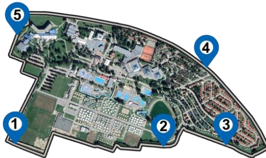
Slika 6: Izgradnja večnamenske poti