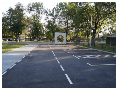
Slika 2: Prenova glavnega vhoda