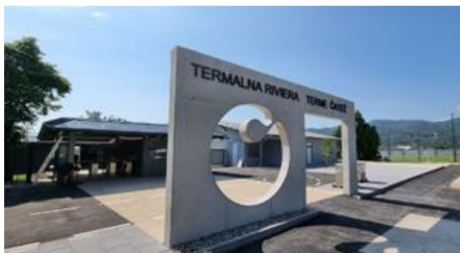
Slika 1: Prenova glavnega vhoda

Izvedena je bila celovita prenova vhoda in garderob na letno Termalno riviero (LTR). S projektom smo osmislili in poudarili vhod in vhodne objekte LTR v Termah Čatež. Na obstoječem platoju pred vhodom v LTR se je vzpostavil vhodni trg, prostor dogajanja, kamor ljudje zahajajo tudi izven delujočih ur zunanjega kopališča, zaradi prijetnega in odprtega ambianta, ki ga prostor sam po sebi ponuja. Ob interventnem uvozu na LTR, ki edini ostaja asfalten in ga od ostalega prostora platoja ločita dve črtkani črti, se je vzpostavil vezni člen nove ureditve vhodne ploščadi, ki povezuje nove urbane elemente in oznake prostora, ki ustvarijo duh trga in označujejo prihod na glavno letno riviero v Termah Čatež. Na vhod in povezovalni tepih proti parkirišču opozori veliki reklamni »totem« v obliki vhodnega portala, skozi katerega obiskovalci s parkirišča dostopajo do vhoda k LTR. Betonski monolit z znakom Term Čatež tako od daleč opozarja na vhod. Gre za osvežitev zunanosti objekta in zamenjavo kritine na obeh objektih ter za vzpostavitev primerne vhodnega platoja, ki omogoča mirno in varno zadrževanje na trgu pred vhodnim objektom za nakup vstopnic.