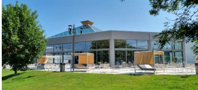
Slika 3: Širitev restavracije

V mesecu oktobru 2021 se je pričela izvajati investicija širitev zimske Termalne riviere, kar zajema širitev obstoječega gostinskega obrata Valovi. Investicija je zaključena. Investicija je zajemala dograditev prizidka na 170 m 2 v obliki zimskega vrta, kjer moderno zasnovana restavracija s poudarkom na estetiki opreme ponuja pester izbor pripravljene hrane in sladic (sveže pripravljena pica, sladoled, palačinke, itd.). V sklopu zunanje ureditve objekta je urejena tudi terasna ploščad, ki med drugim nudi tudi območja za sprostitvev z namensko izbranim vrtnim pohištvom.