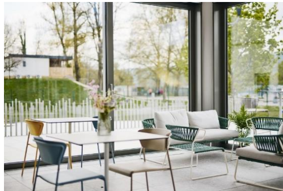
Slika 4: Širitev restavracije