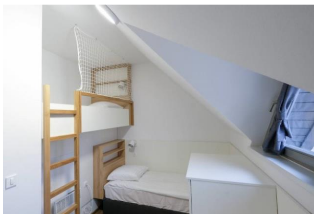
Slika 1: Prenovljena spalnica