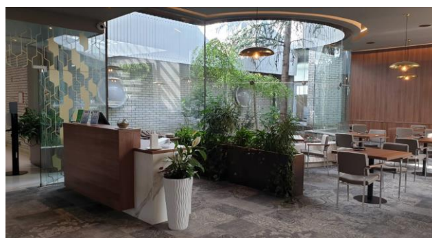
Slika 4: Prenovljeni vhod v restavracijo