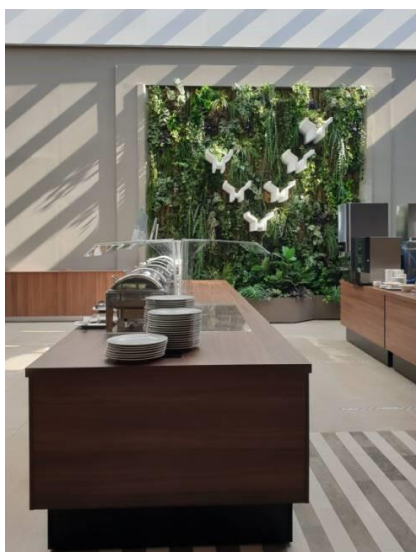
Slika 3: Prenovljena restavracija