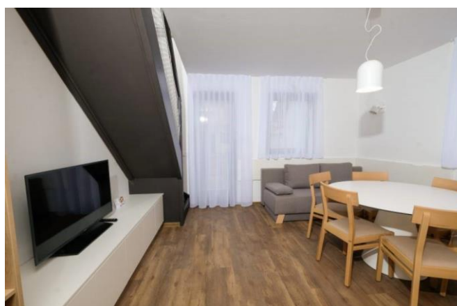
Slika 2: Prenovljena dnevna soba